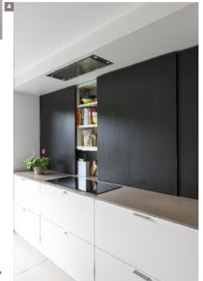
< Keramische vloertegels 60 x 60 cm: vanaf 30 euro/m 2 , excl. btw