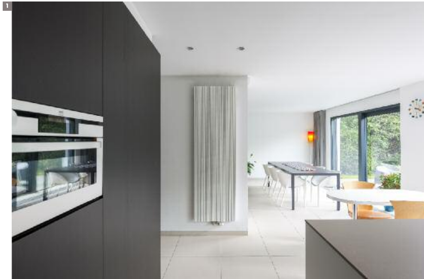
▼ Keukenwerkblad in Silestone: 300 - 400 euro/m 2 , excl. btw (voor een dikte van 12 mm)