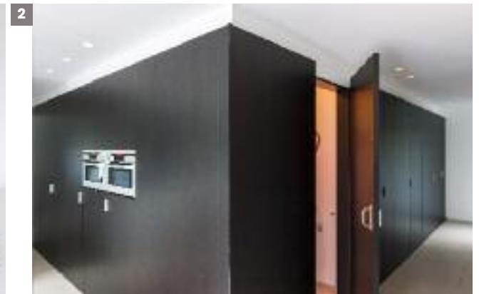
▲ Dubbelzijdige panelen in Shinnoki fineerhout: vanaf 68 euro/m 2 , excl. btw